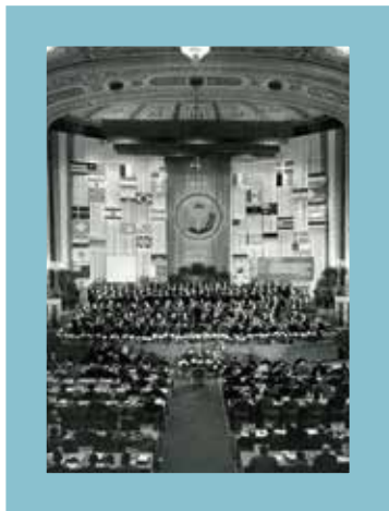
Kongres Medzinárodnej konfederácie slobodných odborov vo Viedni, 1955

Z hľadiska odborov je Rakúsko malou, na európskej a globálnej rovine hospodársky silne ovplyvňovanou krajinou, preto sa vždy prikladal veľký význam medzinárodnej spolupráci. Medzinárodné vzťahy Rakúskeho odborového zväzu ÖGB sú dnes preto veľmi rôznorodé.