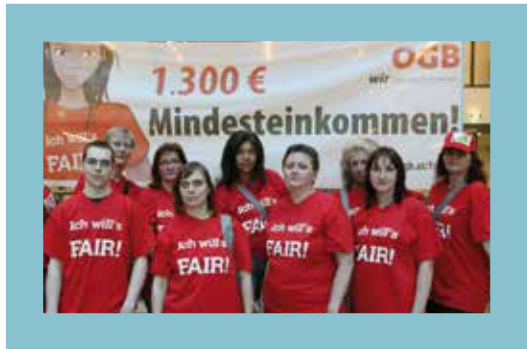
Akcia Rakúskeho odborového zväzu ÖGB za vyššiu minimálnu mzdu ÖGB-Aktion für höheren Mindestlohn ÖGB campaign for higher minimum wages Action de l'ÖGB pour une augmentation du salaire minimum Мероприятие ОАП за повышение минимальной зарплаты

Samozrejme, že aj Rakúsky odborový zväz ÖGB dostáva príležitosti na protestné akcie a kampane. Rakúsky odborový zväz ÖGB organizuje akcie a kampane, aby informoval a mobilizoval. Od novembra 2005 do leta 2006 uskutočnil Rakúsky odborový zväz ÖGB kampaň podnikovej rady, ktorej cieľom bolo iniciovať založenie podnikových rád. Výsledkom boli početné združenia podnikových rád, takmer tisíc nových členov podnikovej rady sa pridalo k Rakúskemu odborovému zväzu ÖGB. Rakúsky odborový zväz ÖGB uskutočňuje taktiež časté kampane s nevládnymi organizáciami, ako napríklad kampaň STOPP-GATS alebo tiež aktivity zasadzujúce sa za celosvetovú daň z finančných transakcií.