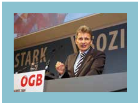
Prezident Rakúskeho odborového zväzu ÖGB Erich Foglar pri spolkovom kongrese 2009

ÖGB-Präsident Erich Foglar beim Bundeskongress 2009