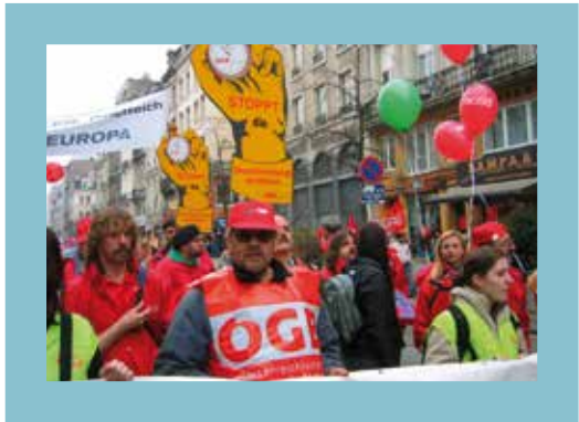
Účasť na demonstrácii Európskeho odborového zväzu v Bruseli, 2005 Teilnahme an EGB-Demonstration in Brüssel, 2005 Participating in ETUC rally in Brussels, 2005 Participation à la manifestation du CES à Bruxelles, 2005 Участие в демонстрации ЕКП в Брюсселе в 2005 году

Nakoniec, mier a bezpečnosť môžeme celosvetovo docieľiť len trvalo udržateľným zlepšením životných podmienok. Rakúsky odborový zväz ÖGB preto presadzuje odzbrojovacie opatrenia v nukleárnej aj konvenčnej oblasti, ako aj mierovú zahraničnú politiku Rakúska na základe aktívnej neutrálnej politiky.