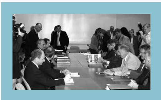
Začiatok vyjednávania platobných podmienok v kovospracujúcom priemysle, 2006

Odbory Rakúskeho odborového zväzu ÖGB uzatvárajú v rámci svojej politiky kolektívnych zmlúv ročne asi 500 zmlúv. Kolektívne zmluvy v Rakúsku platia nie len pre členov odboru, ale pre všetky podniky a zamestnancov príslušnej oblasti pôsobenia. Podľa OECD existuje v Rakúsku koncentrácia kolektívnych zmlúv vo výške viac ako 95 %, čo má za následok, že zamestnanci majú